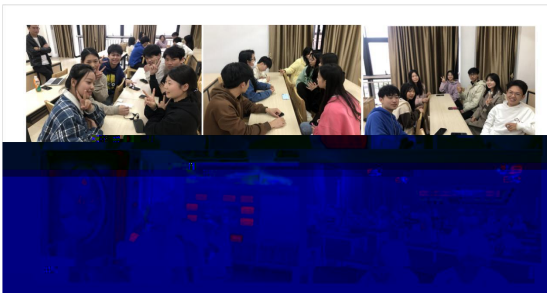
同学们在课堂实训场景